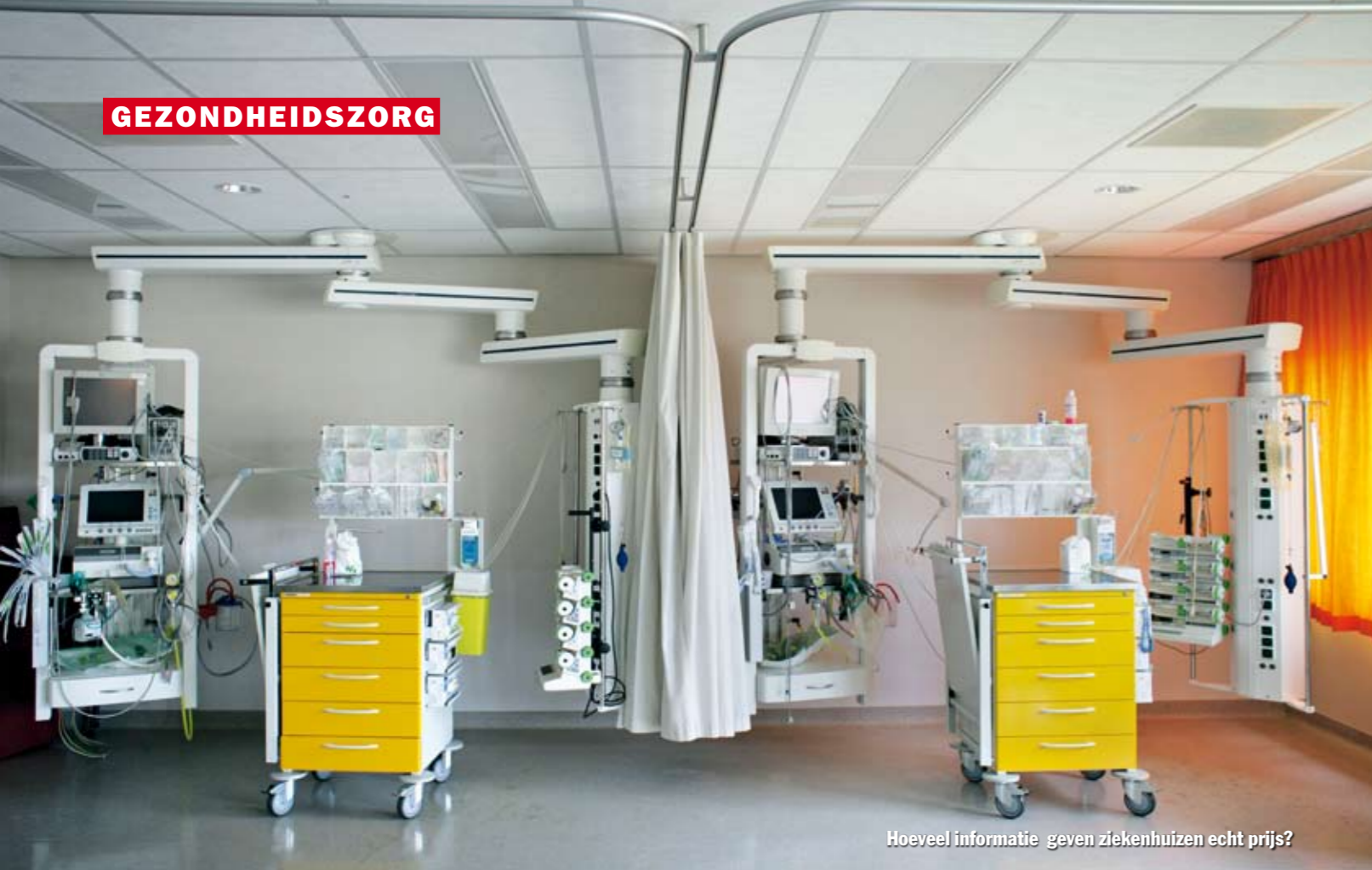
Hoeveel informatie geven ziekenhuizen echt prijs?