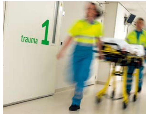
Zowel acute zorg als zorg waarvoor een afspraak is gemaakt

verzekeraars (zie 'Hoe zijn ziekenhuizen beoordeeld?' op pagina 70). Daarnaast zijn volumennormen opgenomen voor het minimumaantal operaties dat chirurgen moeten doen, volgens eigen wetenschappelijke normen, wil de patiënt zich in veilige handen weten. De ervaringen van patiënten, verzameld via enquêtes – de Consumer Quality Index, ontworpen op initiatief van verzekeraars – tellen dit jaar voor het eerst mee in de eindbeoordeling. Verder is gebruik gemaakt van gegevens over wachtlijsten en van jaarverslagen. Ook is de 'zorgzwaarte' van ziekenhuizen berekend, ofwel het type patiënt dat ze bedienen.